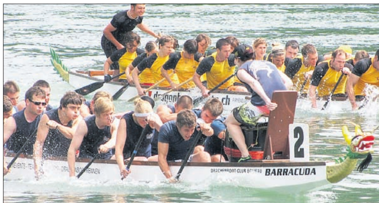
Im Vordergrund kämpfen die Greifensee Dragons auf einem Boot des örtlichen Veranstalters in Eglisau. (ü)

Zu Beginn des diesjährigen Sommers konnten die Greifenseer ein neues Drachenboot in Empfang nehmen. Da ihr altes Boot trotz steter Pflege nicht mehr dem internationalen Standard entsprach und sie somit nicht mehr konkurrenzfähig waren, wurde das neue Boot angeschafft.